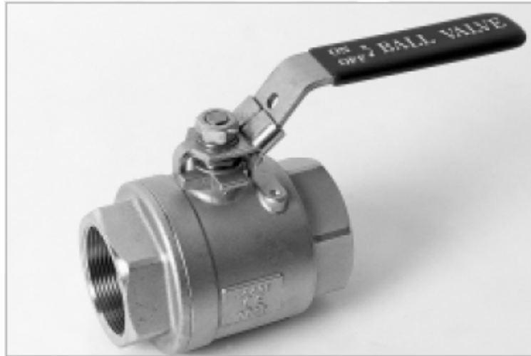
Pressure - Temperature Rating 1/4" - 4"